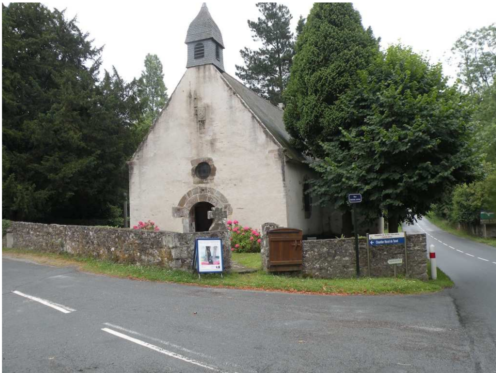
La Chapelle De St Buc