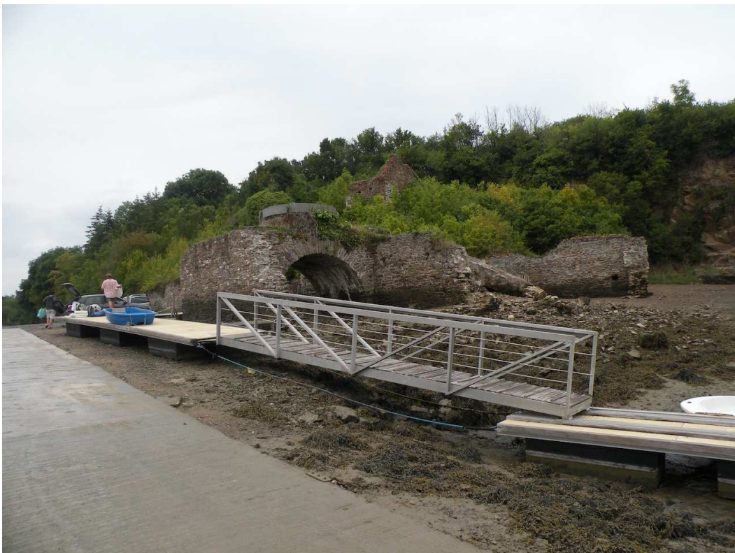
Les vestiges du moulin à marée de Fosse Mort.