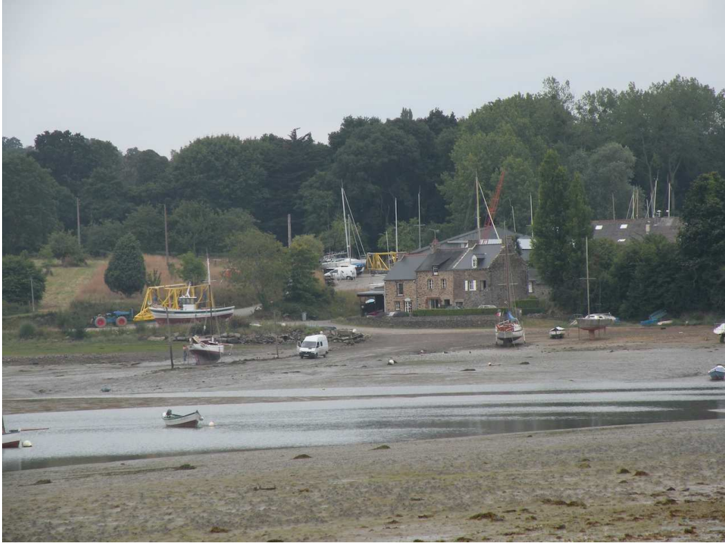
Le chantier naval du Tanet