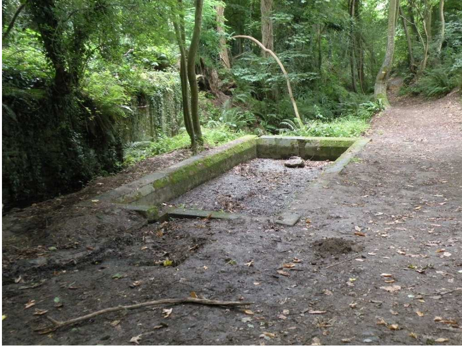
Le lavoir de la Guérouse