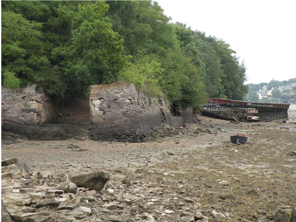
Les vestiges du moulin à marée de Fosse Mort.